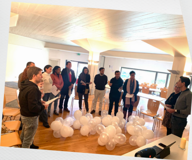
Reunión de matrimonios