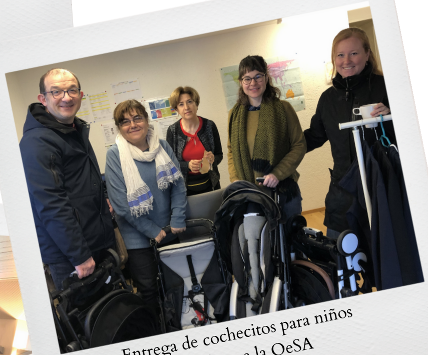
Entrega de cochecitos para niños y maletas a la OeSA