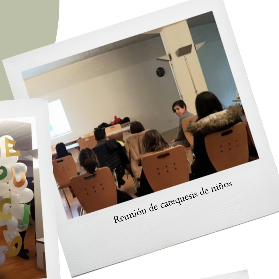
Reunión de catequesis de niños