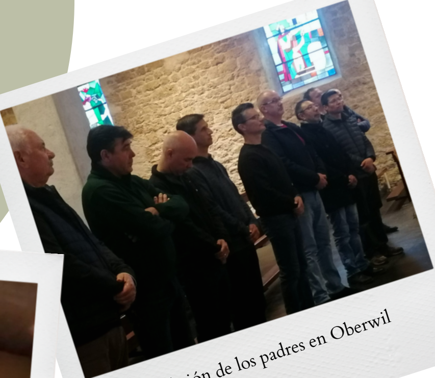
Bendición de los padres en Oberwil