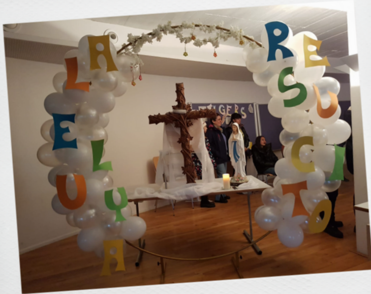
Reunión de catequesis de niños