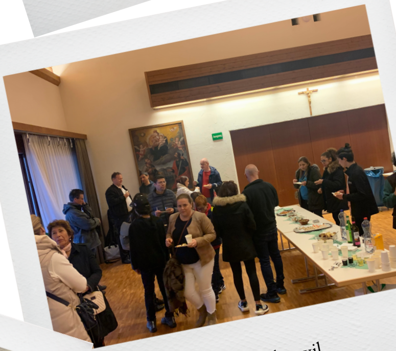
Aperitivo en Oberwil